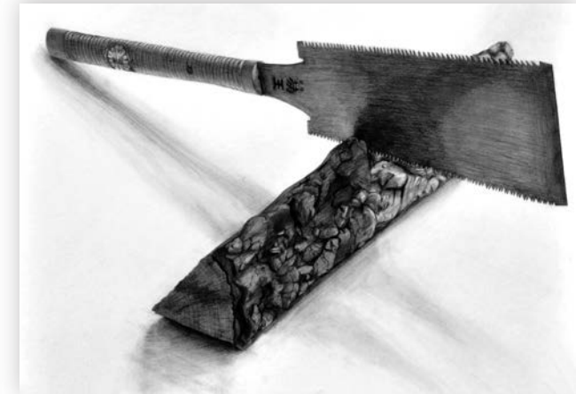
鉛筆静物デッサン