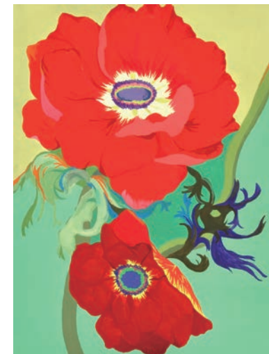
色彩表現(モチーフ構成)