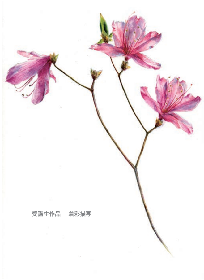
受講生作品 着彩描写