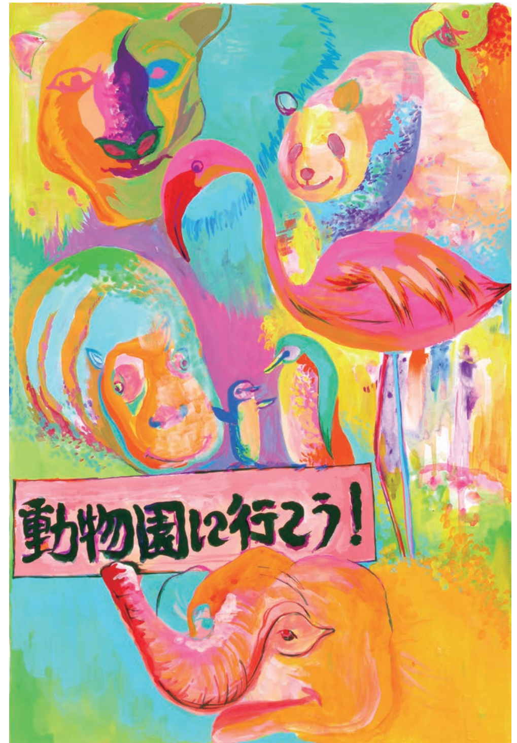
受講生作品 色彩表現 イメージ:「動物園に行こう!」